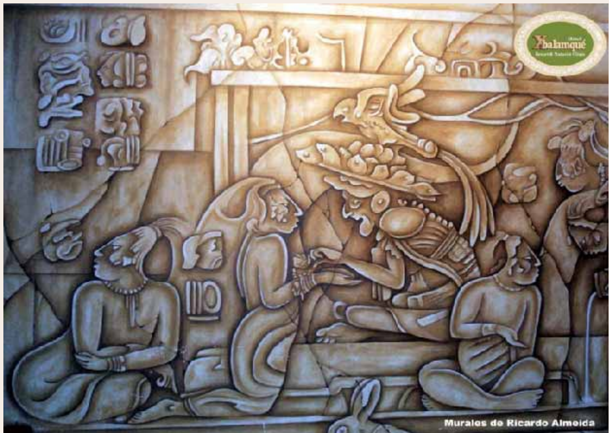
Murales de Ricardo Almeida

Hermoso mural del artista plástico mexicano Ricardo Almeida, que rememora la notable civilización Azteca y sus personajes rescatados de la destrucción y del olvido, que en tiempos del colonialismo fueron objeto de la sistemática desfrucción y ocultamiento. Creemos que es un deber insoslayable ade las actuales generaciones centroamericanas, herederas de aquella civilización, como la de los Mayas y la de los Incas, procurar la myor difusión posible de los descubrimietnos que se llevan cabo sobre ellas.